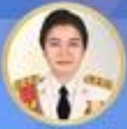
กรมส่งเสริมสุขภาพ กรมควบคุมโรค